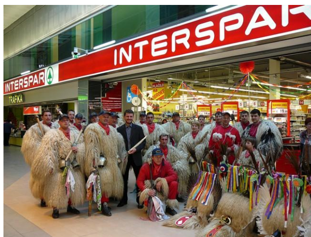
Slika 1: Kurenti v nakupovalnem središču