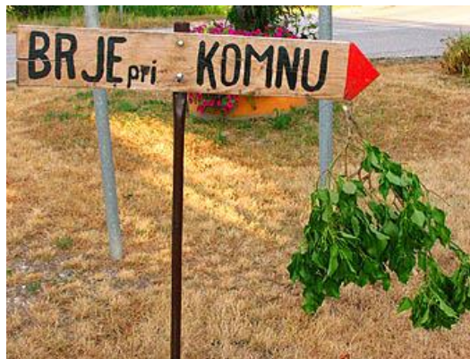
Slika 5: Osmice označujejo s frasko oz. brinovo ali bršljanovo vejo

Načeloma naj bi tako na osmicah kot v vinotočih ponujali le lastna vina in druge doma pridelane (brez) alkoholne pijače ter hladne narezke, domač kruh, potico, krajevno značilne enolončnice (npr. jota, bograč, klobasa s kislim zeljem).