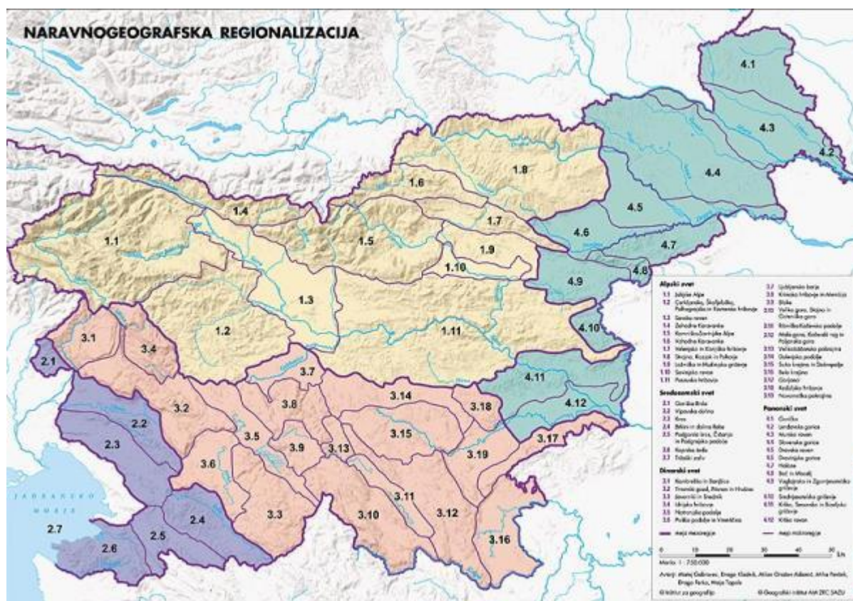
Slika 8: Naravnogeografska regionalizacija Slovenije

Z geografskega vidika se na slovenskem ozemlju stikajo in prepletajo štiri velike evropske reliefne enote: Alpe in Dinarsko gorstvo ter Panonska in Jadranska kotlina. Hkrati se na območju Slovenije prepletata tudi dve podnebji: celinsko in sredozemsko. Iz tega izhajajo štirje temeljni tipi pokrajin: alpski, dinarski, panonski in sredozemski (Perko, 1998).