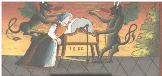
Slika 6: Hudič brusi babi jezik, priljubljen motiv na panjskih končnicah

Naloga: poišči vsaj tri priljubljene motive s panjskih končnic.