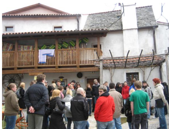
Slika 7: Hostel Pliskovica