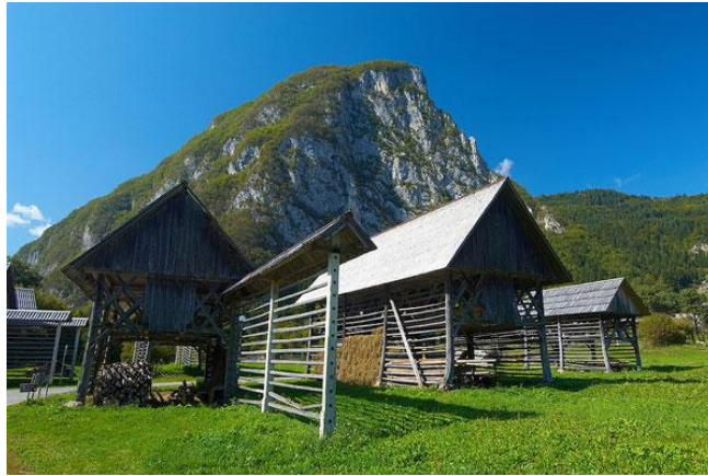
Slika 4: Dvojni kozolec ali toplar

obliko, saj segajo v čas 18. stoletja. Najlepši primerki dvojnih kozolcev so nastali med prvima polovicama 19. in 20. stoletja in poleg funkcionalnosti predstavljajo prave tesarske mojstrovine s številnimi konstrukcijskimi in oblikovnimi podrobnostmi.