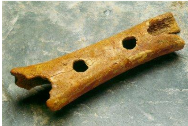
Slika 2: Piščal iz Divjih bab

Najpomembnejša najdba iz tega časa je leta 1995 odkrita piščal iz Divjih bab, stara okoli 45.000 let, domnevno najstarejše glasbilo na svetu (zagotovo pa v Evropi). Iz stegenice mladiča jamskega medveda naj bi jo izdelal neandertalec, in sicer načrtno z vrtnanjem lukenj.